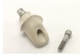
Pektkon® Custom Abutment