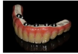
Pektkon® Implant Bridge