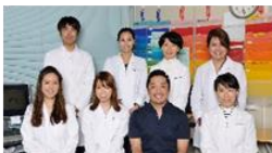
デンタルルネサンス CAD/CAMセンタースタッフ